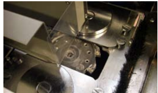
2 mm Fräsung und Schlitzung