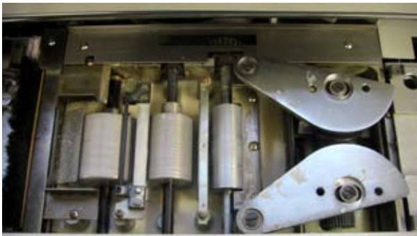
3 Leimaufragswalzen aktive Seitenbleimung