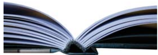
Optimales Aufschlagverhalten der Lagen