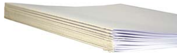
Erstellung von digital gedruckten Signaturen