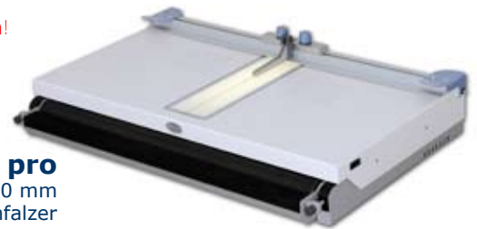
Casematic H32/H46 pro Decken bis 700 x 330 mm / 1040 x 490 mm Vakuumschisch / Kantenfalzer

Die genaue Positionierung auf dem Leuchttisch wird durch Markierungen erleichtert. Dank Vakuumschisch kein Verrutschen des Druckbogens.