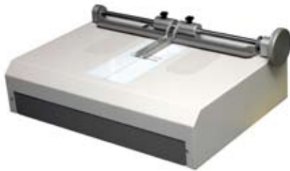
Casematic lite Einstiegsmodell bis A4 Vakuumschisch

-keine Buchbinderkenntnisse erforderlich-