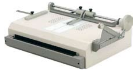
Casematic Komfortmodell bis A4 Vakuumschisch / elektrischer Kantenfalzer