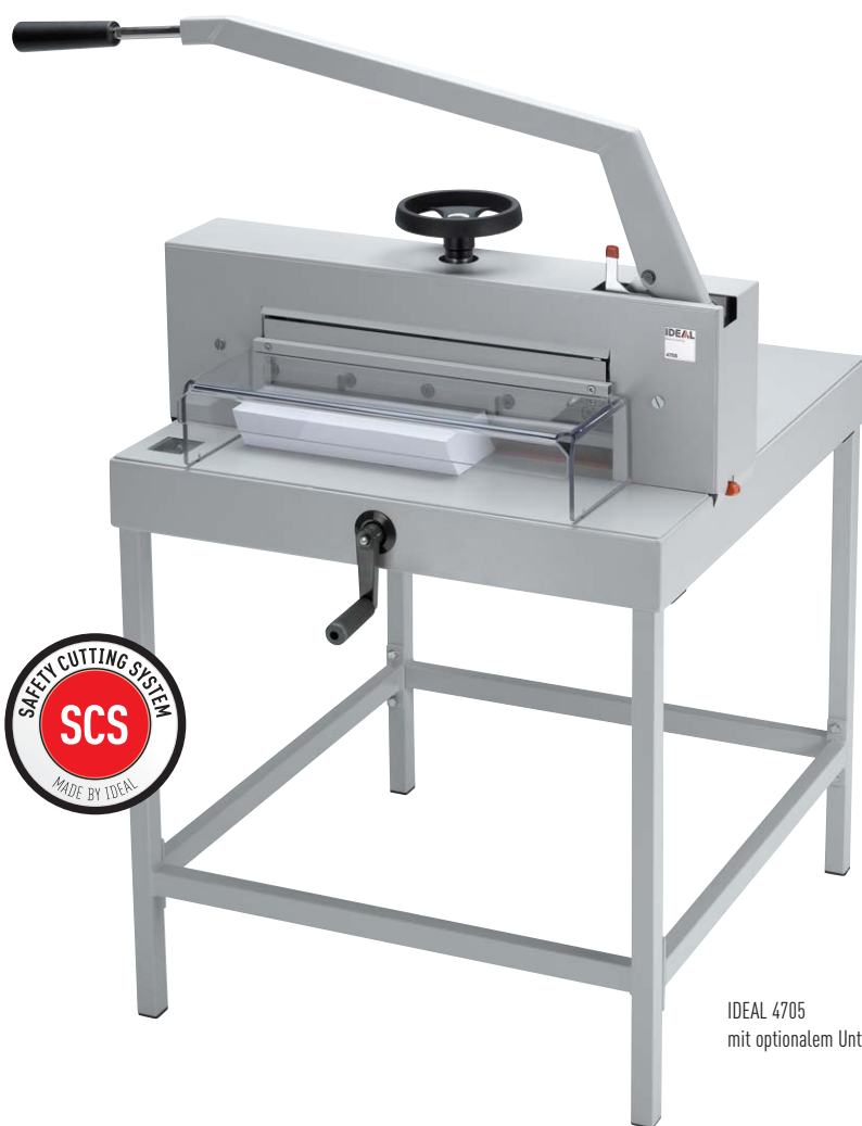
IDEAL 4705 mit optionalem Untergestell