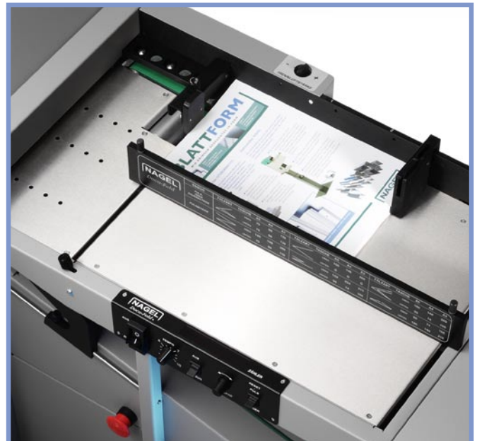
Der Anlagetisch ist übersichtlich und einfach in der Handhabung.

■ Auch die Falzwalzen bedürfen keinerlei Justierung, da sie sich automatisch auf die Papierstärke einstellen – dieses Prinzip spart Zeit und eliminiert Fehlerquellen. Die Digitalanzeige arbeitet auf 0,1 mm genau und lässt sich mühelos programmieren.