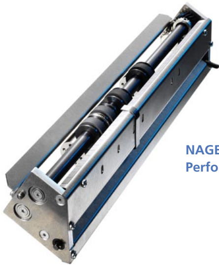
NAGEL DOCUFOLD Perforiereinsatz.