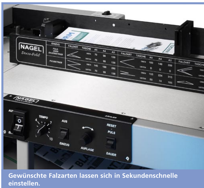
Gewünschte Falzarten lassen sich in Sekundenschnelle einstellen.