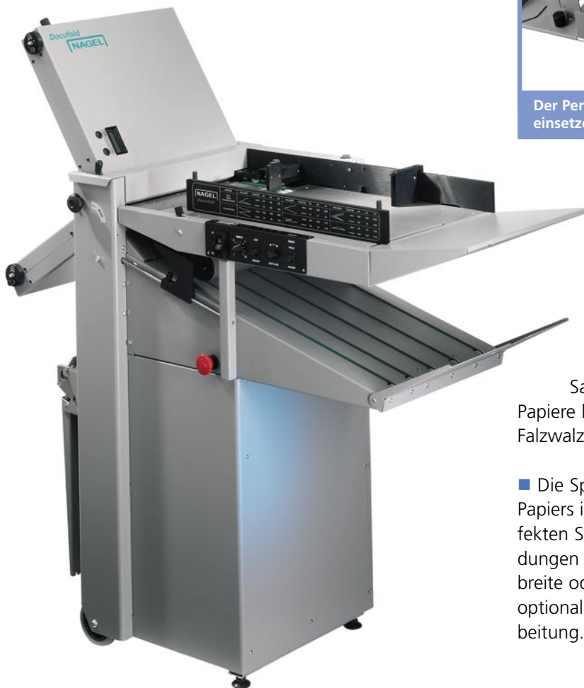
NAGEL DOCUFOLD – kompakt und leistungsstark.

■ Für hochwertige Qualität unerlässlich ist die exakte Winkeligkeit beim Falzen, diese wird durch die serienmäßige Ausrichtstrecke sichergestellt. Bei anderen Falzmaschinen oftmals ein Problem, für die Docufold eine einfache Sache: Statisch aufgeladene oder auch gewellte Papiere laufen Dank des Vakuumschneidesystems staufrei in die Falzwalzen ein.