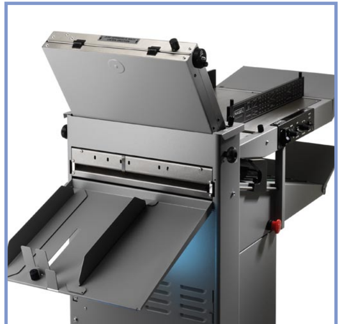
Der Perforiereinsatz lässt sich mit wenigen Handgriffen einsetzen.

■ Die Docufold ist mit vielen durchdachten Details ausgestattet. So sorgt das eingebaute Unterflur- und Saugrad für die schonende Blattvereinzelung. Das Saugprinzip eignet sich für empfindliche Digitaldrucke ebenso wie für Offsetdrucke oder Kopien.