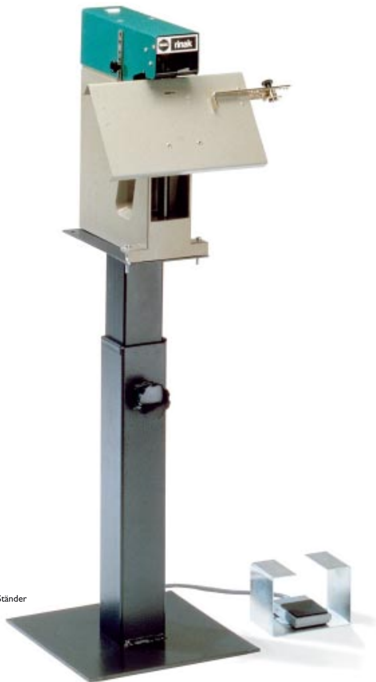
Rinak auf höhenverstellbarem Ständer mit Fußschalter

Broschüren- und Blockheftung einfach und schnell.