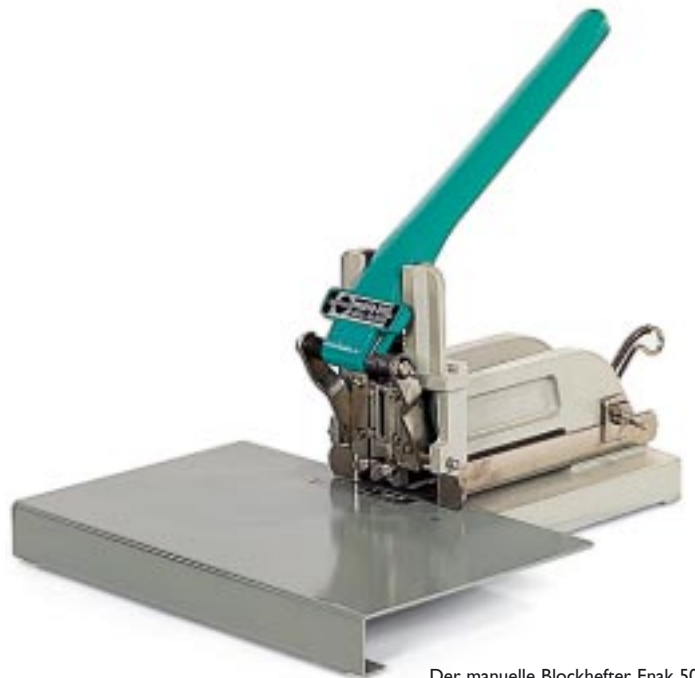
Der manuelle Blockhefter Enak 50-200