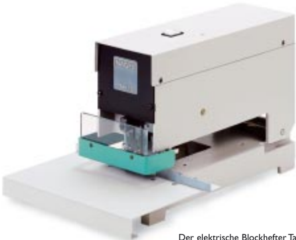
Der elektrische Blockhefter Tak 18