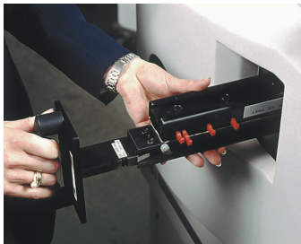
Einfach zu wechseln