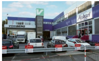
Die Niederlassung der H.J. OnLineCopy Document Service GmbH im Goethering 52 in Offenbach ist mitunter die Produktionsstätte für klebegebundene Bedienungsanleitungen etc.

Die vierte Niederlassung im Goethering in Offenbach gilt als Produktionsstätte im Verborgenen. Hier werden hauptsächlich Bedienungsanleitungen digital gedruckt und zu Klebegebundenem verarbeitet, während die anderen Filialen online Rück-