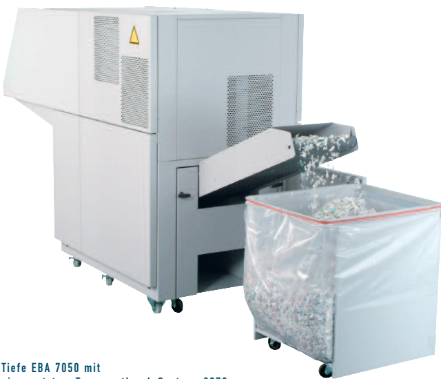
Tiefe EBA 7050 mit eingesetztem Transportband-System: 3070 mm