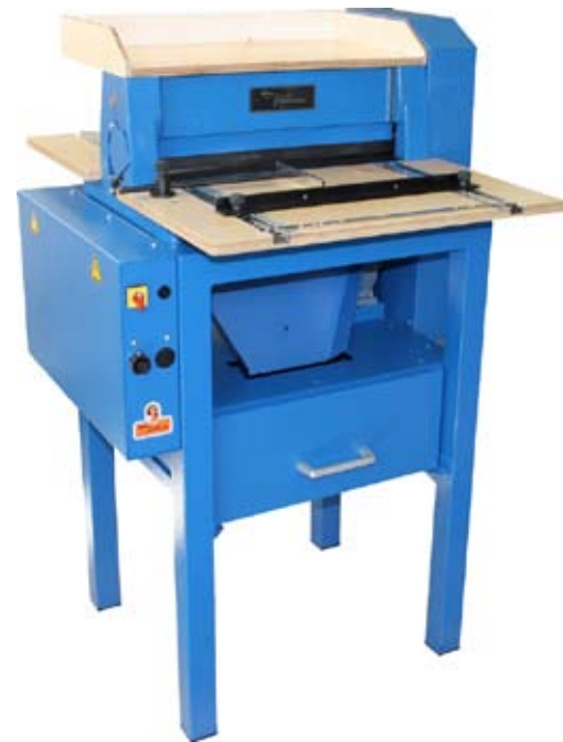
45 ME Elektrisches Standmodell

Normal-Perforierkamm (Loch 1,1 mm), Schlitz-Perforierkamm (Strichperforation), Rechteck-Perforierkamm (Plastikringbindung). Nutkämme mit Nutbreiten 1,0/ 1,5/ 2,0/ 3,0/ 4,0 mm, Doppelnutkamm, „Wire-O“®-Stanzwerkzeuge mit: Rechteck- oder Rundlochstempel je mit Daumenloch 20 mm. Registerschnitt-Werkzeug.