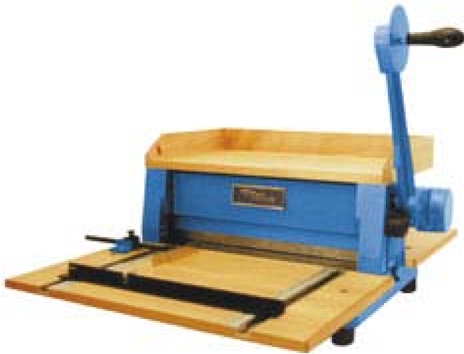
EXPO Manuelles Tischgerät

Arbeitsbreite 45 oder 50 cm (Nutbreite), diverse Perforier- und Nutkämme, mit nur wenigen Handgriffen erweiterbar zur Motor-Perforiermaschine. Unverwüstliche Guss-Konstruktion.