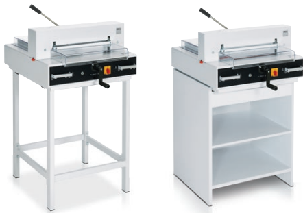
Untergestell optional Unterschrank optional