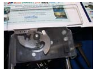
Trennmesser mit Trennluft