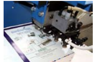
Schuppenanleger mit Hinterblattkantentrennung