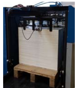
Option Palettenauslage Stacker -> S.2