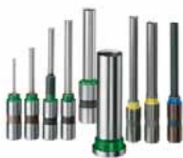
Nagel Papierbohrer: 2–35 mm Durchmesser, 50–60 mm Nutzlänge, sowie Sonderanfertigungen.

Mit Nagel-Bohrunterlagen aus Spezialpappe wird auch das unterste Blatt des Papierstapels sauber durchbohrt und zugleich die Bohrleiste aus Kunststoff geschont.