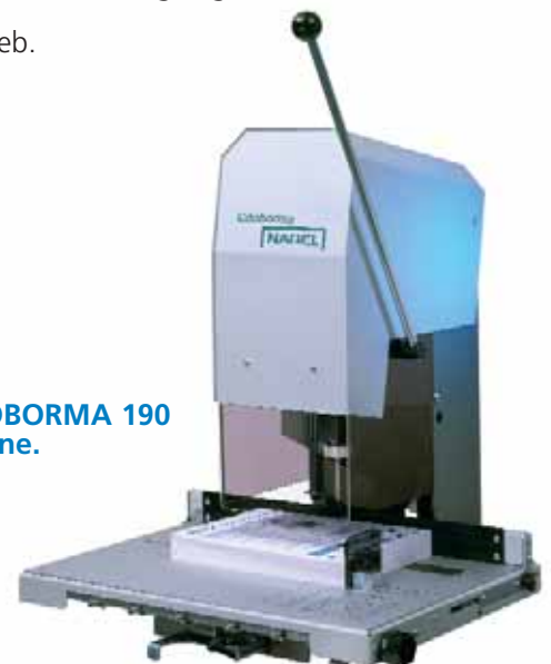
NAGEL CITOBORMA 190 Tischmaschine.