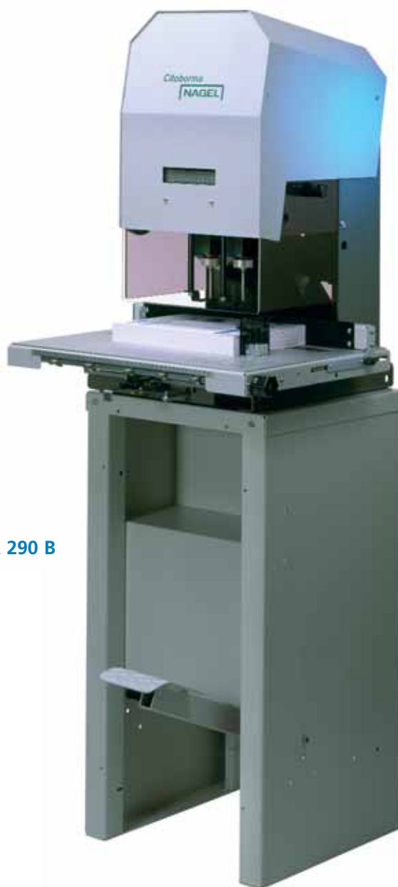
NAGEL CITOBORMA 290 B Abb. mit Fußpedal.