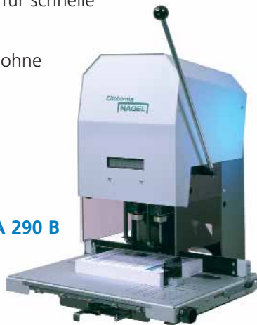
NAGEL CITOBORMA 290 B Tischmaschine.