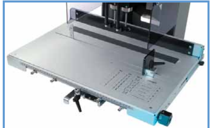
Der Schiebetisch löst automatisch aus.