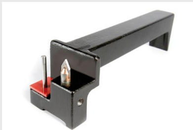
NAGEL-Bohrerschärfer für schnelles Nachschleifen „vor Ort“