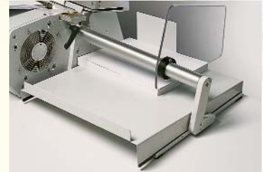
Papierablage für perforierte Blätter

HALBAUTOMATISCHES STANZEN Durch die von Renz entwickelte Teilautomatisierung wurde eine völlig neue Maschinenklasse geschaffen. Damit ist es erstmals gelungen, den Anwendern ein Maschinensystem anzubieten, die hohen Bedienkomfort, Schnelligkeit, Flexibilität und Wirtschaftlichkeit erwarten.