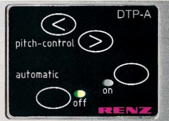
Übersichtliches Bedienfeld zur Einstellung aller Parameter