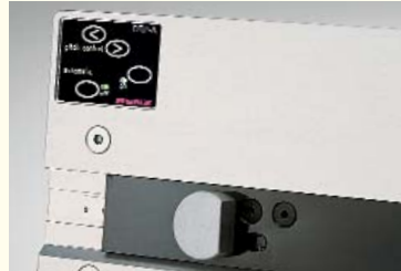
Papieranlage mit Sensor, der den Stanzvorgang auslöst