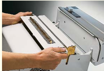
Schneller und problemloser Werkzeugwechsel in 1-2 Minuten