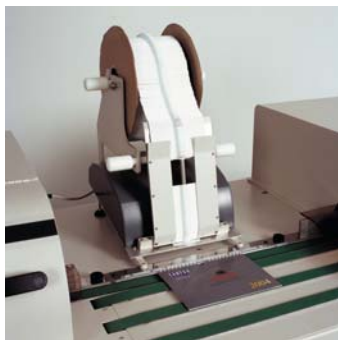
"Plug and play" Aufhänger-Zufuhr