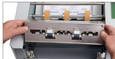
Die Messerkassette kann sehr einfach entnommen und gewechselt werden z.B. für Perforier- oder Rillmesser