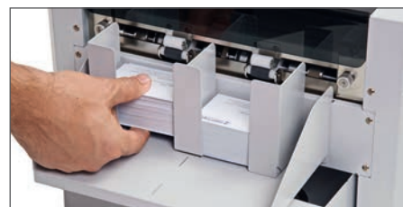
Universell einstellbare magnetische Ablage