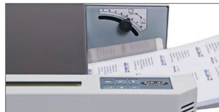
Einfache Bedienung und individuelle Einstellung der Papierstärke

Die fertig geschnittenen Endformate werden in einer universell einstellbaren Ablage sauber abgelegt und können von dort bequem entnommen werden. Extrem langlebige Längs- und Quermessereinheiten sorgen auch bei einer hohen Anzahl von Schnitten stets für ein professionelles Erscheinungsbild!