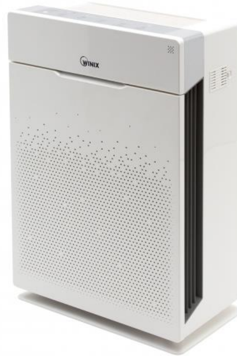
WINIX ZERO Pro 5-Stufen Filter

WINIX Luftreiniger befreien die Raumluft schnell und effektiv von Partikeln (PM2.5), Milben, Pollen, Schimmel, Haaren, Gerüchen und Zigarettenrauch und reduzieren Bakterien/Viren*.