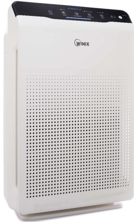
WINIX ZERO: 4-Stufen Filter