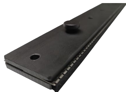
Messerperforiererset serienmäßig bis A4 längs/quer, Eckperforation