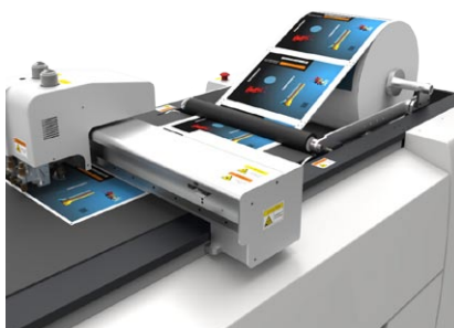
Abrollleinrichtung für Rollenware