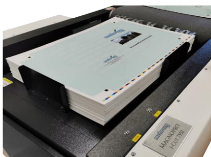
Feeder mit großer Stapelhöhe