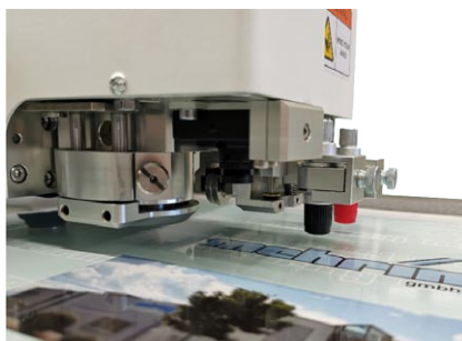
Kopf mit 4 Werkzeugen