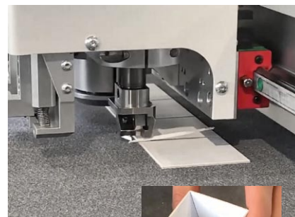
V-Schnitt für Boxen