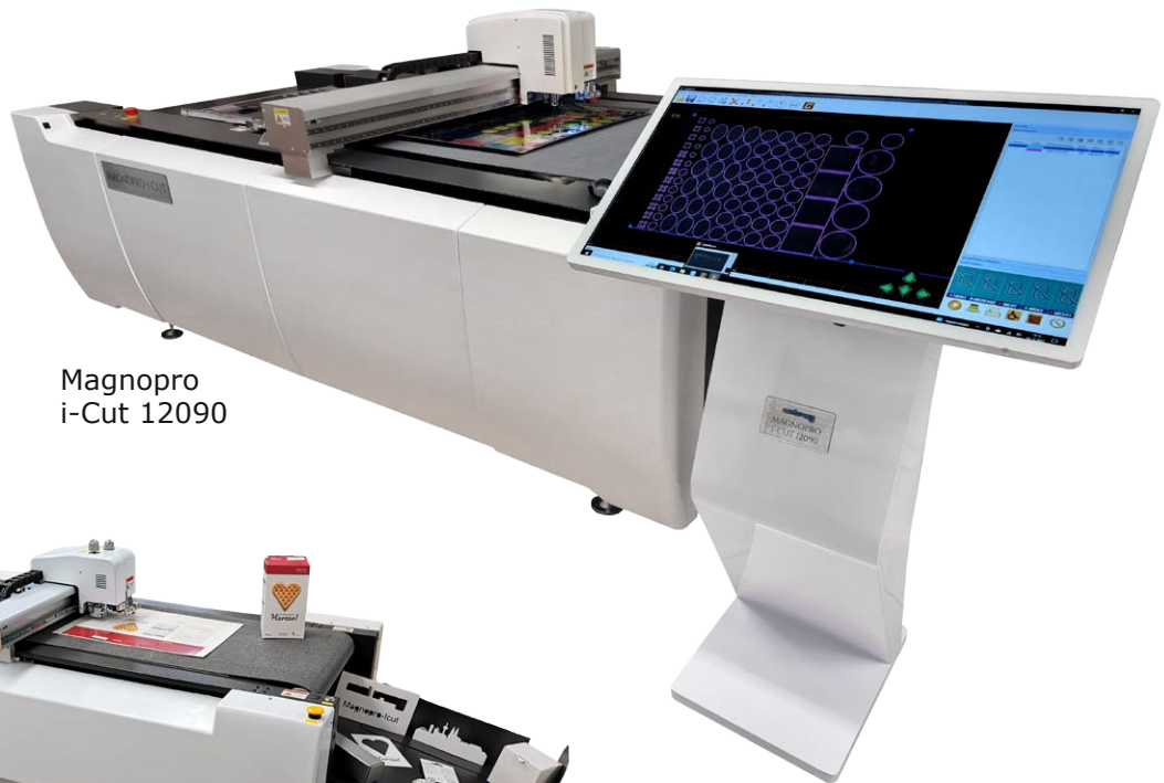
Magnopro i-Cut 12090

Digitales Stanzsystem mit einer Vielzahl an Möglichkeiten: Stanzen, Rillen, Perforieren, V-Schnitt und Anschnitt