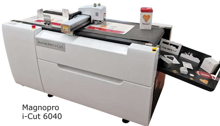
Magnopro i-Cut 6040