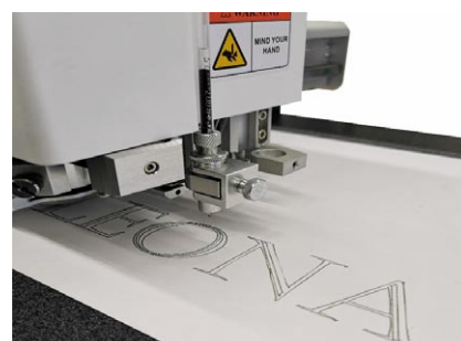
Stift, z. B. für Unterschriften