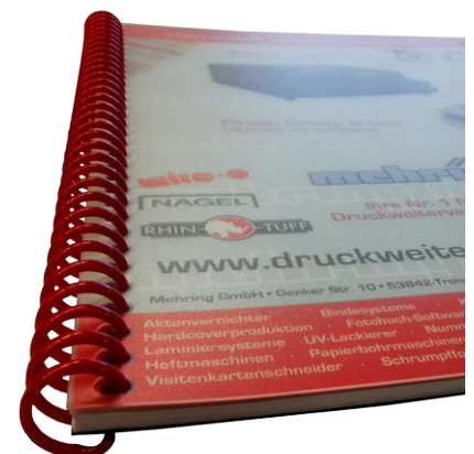
Coilbindung / Plastikspiralbindung