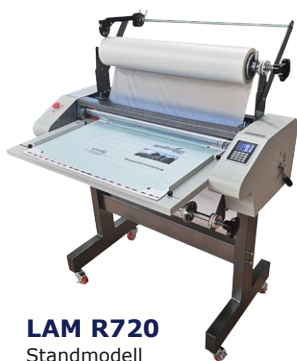
LAM R720 Standmodell

Rollenlaminatoren zur ein- und doppelseitigen Laminierung