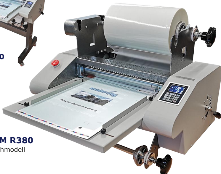
LAM R380 Tischmodell