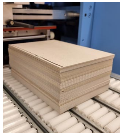
Ausgabe 2 mm Karton