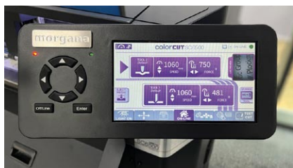
Intuitiver 7-Zoll Multifunktions-Touchscreen