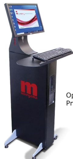
Optionale ColorCut Pro Server Station