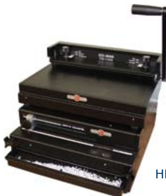
HD 8000 mit OD 4012

Die Schließgeräte HD 8000 und HD 8370 können mit verschiedenen Rhin-O-Tuff Stanzen zur Bindestation kombiniert werden.