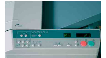
Übersichtliches Bedientableau mit Speichermöglichkeiten für Sonderapplikationen