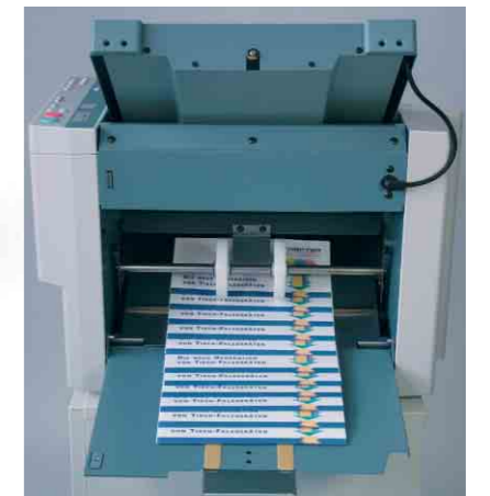
Saubere Ablage des Falzgutes durch automatisch justierte Schuppenablage