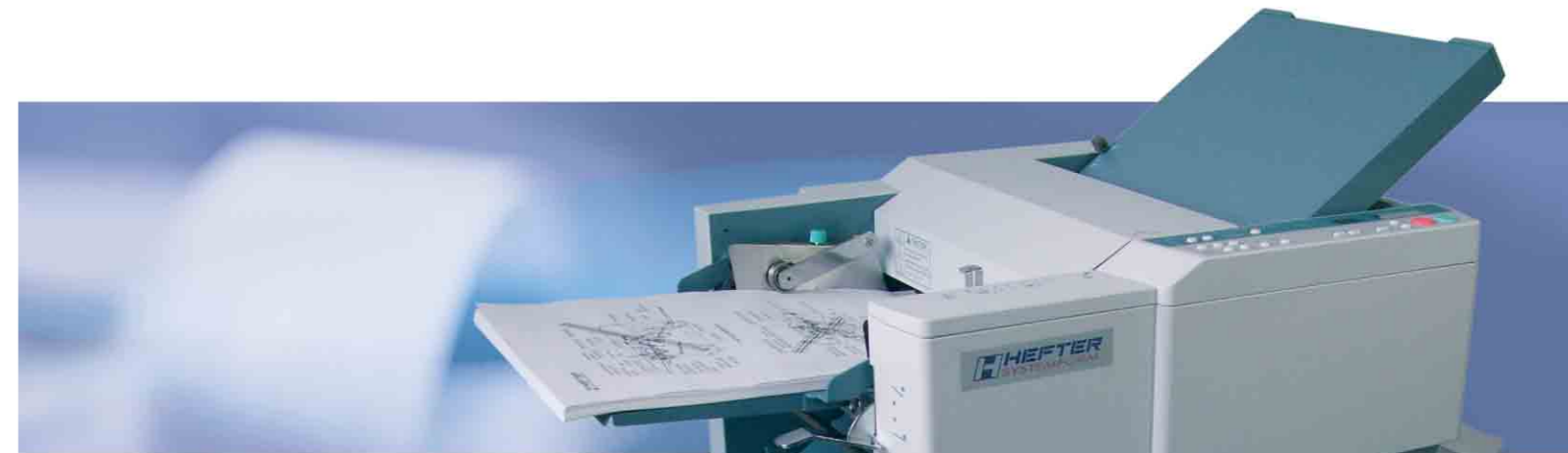
Die perfekte Art, Papier vollautomatisch bis DIN A3 zu falzen