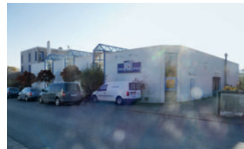
Seit 1990 auf 1.200 m 2 in der Raiffeisenstraße im hessischen Rosbach ansässig: die ristau-druck GmbH.

Broschürenfertigung von ristau konnte die Firma Mehring soweit überholen, dass sie als Backup-Maschine für kleinere Auflagen und für die selten nachgefragten Ringösen-Heftungen weiterhin dienen kann.