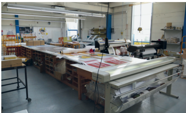
Mit insgesamt 12 Digitaldrucksystemen, vor allem im LFP-Bereich, löst man bei ristau die täglichen Anforderungen an die flexibel aufgestellte Druckerei.

der freundlichen Service-Bereitschaft sowie einer kurzen Lieferzeit von nur 14 Tagen, beschloss der Druckexperte, den nordrhein-westfälischen Händler zu beauftragen, und bestellte den Morgana BM 350 mit optiona-