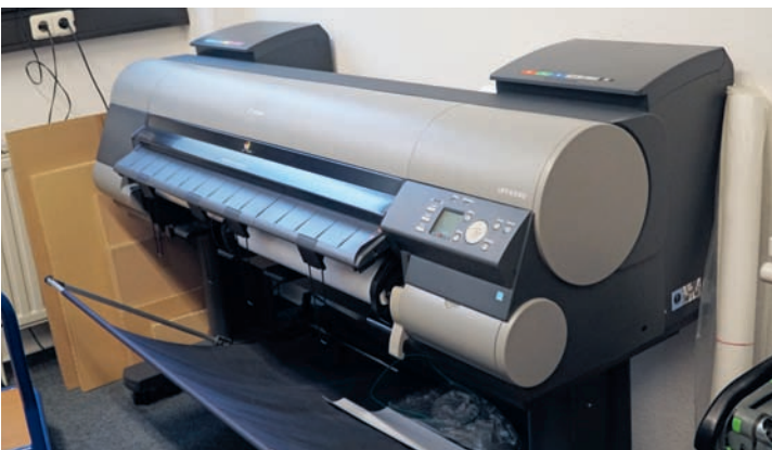
Gelegentliche Anfragen nach Postern und Plakaten bedient OE Media mit diesem Canon-Großformatdrucker.

des Maschinenparks um ein weiteres Drucksystem. Apropos Maschinenpark: Wer Etiketten auf Bogen druckt, muss zwar nicht ab- und aufrol- len, stanzen und entgittern, aber dafür natürlich schneiden. Und so musste auch die Schneidekapazität mit den stei- genden Anforderungen Schritt halten. »Ganz am Anfang konn- ten wir noch eine Schneidema-