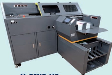
M-BIND M2 Klebebinder

Wir danken allen Besuchern unserer OPEN HOUSE!