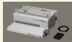
SPB 360 comfort

Hinteres Abdeckblech und Stanzbügel entfernen.